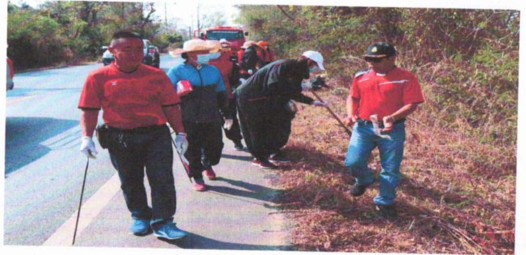
โครงการปลูกป่าเฉลิมพระเกียรติ (ห้องถิ่น สร้างป่า รักษา)